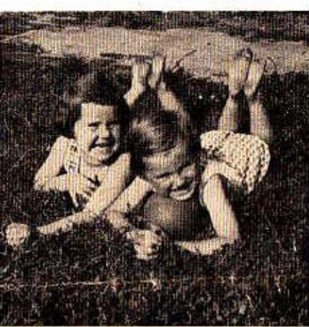
Sonne und Kinderlachen . . .

eingefangen mit der ALTISSA-Box 6 x 6 cm